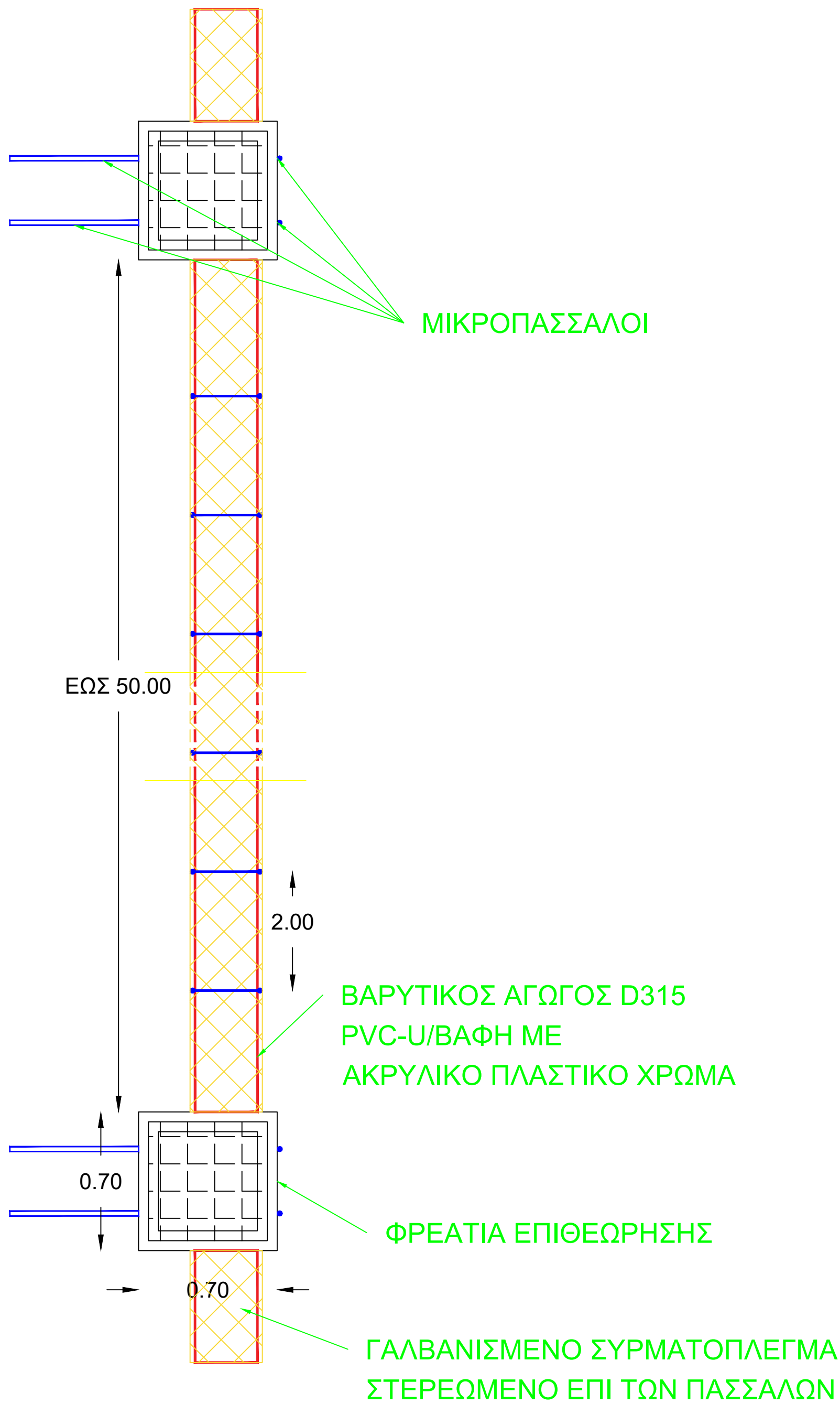
ΚΑΤΟΨΗ ΚΑΤΑΣΚΕΥΗΣ ΕΠΙΦΑΝΕΙΑΚΟΥ ΑΓΩΓΟΥ